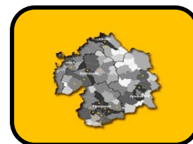
Länsi- ja Sisä-Suomi